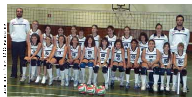
La squadra Under 12 Giovanissime

La musica è arrivata dappertutto, anche sul campo da gioco per allenarsi o prima di una sfida. Poi...ecco la parola "RITMO": "Segui il ritmo!" si dice. Ma cos'è il ritmo? E il tempo? Agli allenamenti di Music-Volley le bambine hanno giocato a pallavolo, hanno suonato, hanno ballato, hanno cantato, hanno capito che nello