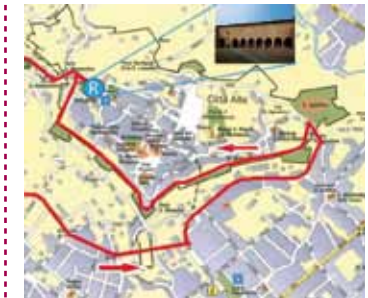
Mappe del percorso

Per maggiori informazioni si rimanda al sito dell'associazione: www.monvico.it