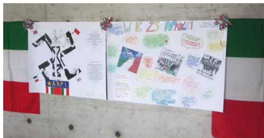
Elaborati che hanno vinto il concorso.

Come voi sapete, nella storia ci sono state persone che per la pace e per la libertà hanno scelto di offrire la propria vita, siano questi spunti di riflessione e di approfondimento per le nostre generazioni.