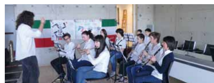
Il gruppo Musica D'Assieme esordisce con l'inno di Mameli.

Cari amici, dobbiamo guardare ed esaminare insieme: che cosa? Noi stessi. Per abitar-