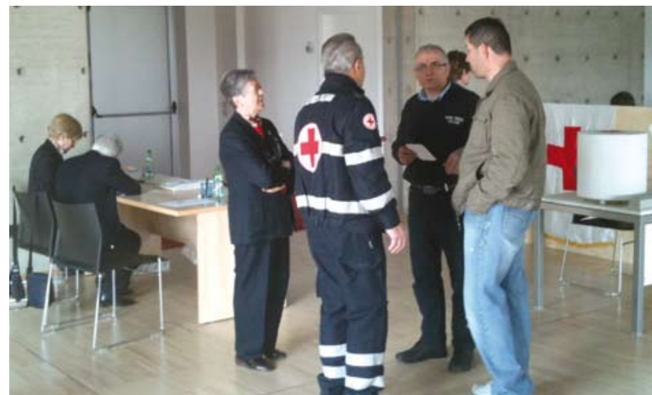
La Croce Rossa durante la giornata del 13 marzo 2010

GRANDE AFFLUENZA PER LA GIORNATA DELL'OSTEOPOROSI CON ESAME MOC GRATUITO