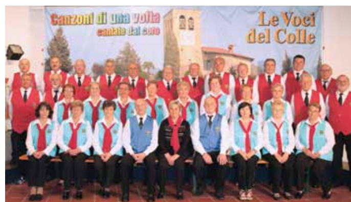
Le Voci del Colle

Il Coro attualmente è composto da 36 elementi, 18 femmine e 18 maschi.