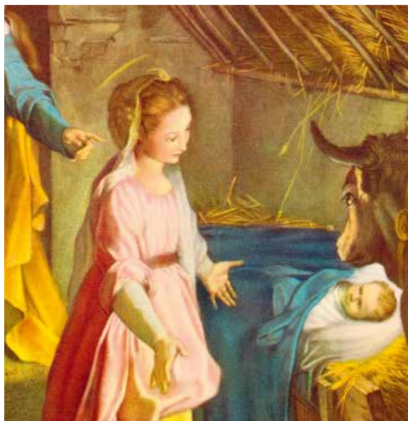
La Natività - il Barrocco - Milano, Pinacoteca Ambrosiana